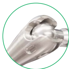
ボールジョイント部 拡大写真 (○部分)