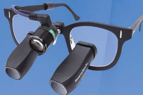
HDI ウルトラミニ PS