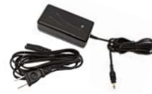
HDI 充電用 AC アダプター、 及び AC コード