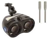
HDI ツインビーム ※ 角度調節ロッドが2本付属