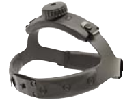
TB ヘッドバンド (ハード)