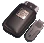
HDI 電源パックセット