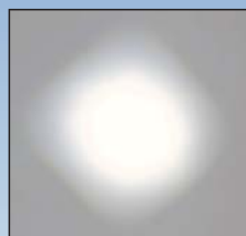
従来のツインビーム (LEDツインビーム)