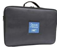
HDI 保管ケース (ツインビーム用)