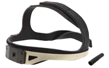
TB ヘッドバンド (ソフト) ※ テンプルクリップが付属