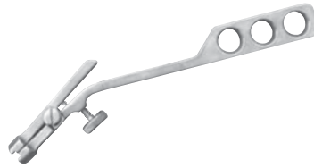
ブレードクランプ